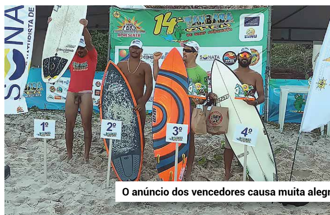
O anúncio dos vencedores causa muita alegria.