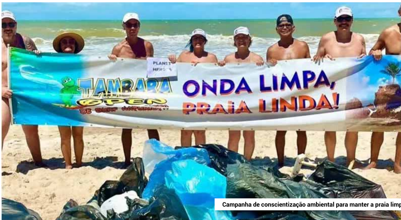
Campanha de conscientização ambiental para manter a praia limpa.