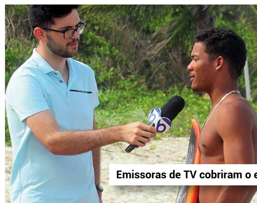
Emissoras de TV cobriram o evento.