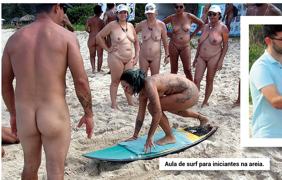
Aula de surf para iniciantes na areia.

Os competidores são divididos em baterias de quatro surfistas por vez. Na água eles usam camisetas coloridas para serem identificados por três jurados, que analisam suas performances dentro de uma tenda montada na areia.