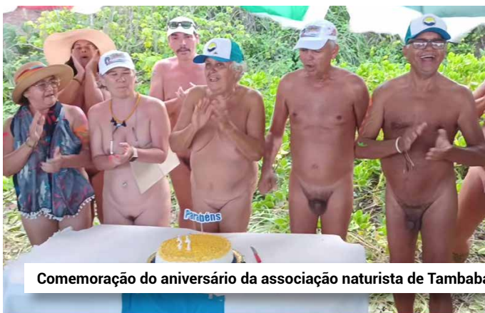
Comemoração do aniversário da associação naturista de Tambaba.

Da areia, naturistas competidores ou não-competidores assistem e torcem pelo seu atleta preferido, enquanto saboreiam uma mesa de frutas e água oferecida por patrocinadores e organizada pelas associações naturistas locais – SONATA e NU – e pela Federação Brasileira de Naturismo. É uma festa que terminará com um bolo comemorativo do vigésimo sétimo aniversário da associação SONATA.